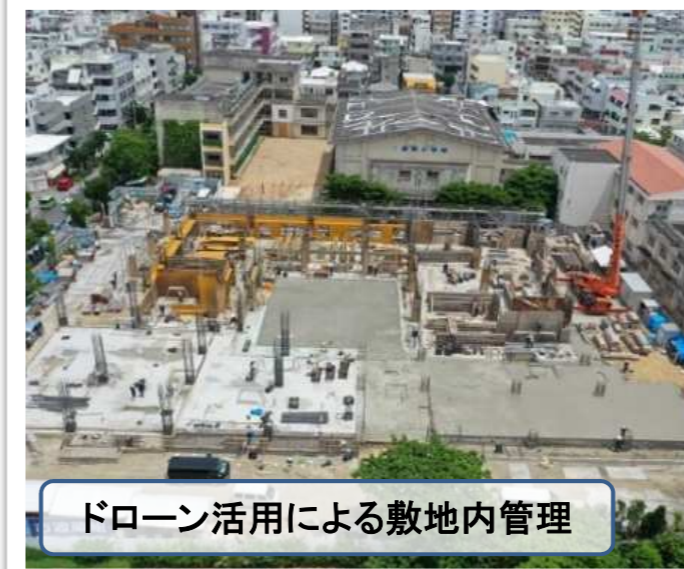
ドローン活用による敷地内管理