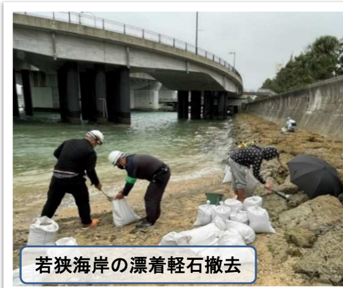
若狭海岸の漂着軽石撤去