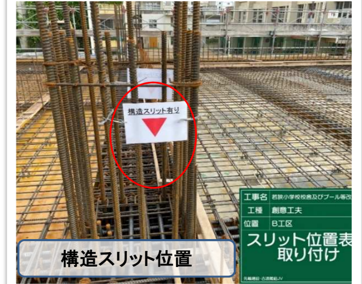
構造スリット位置

工事名 若狭小学校校舎及びプール等改築工事 工種 創設工 位置 B1区 スリット位置表 取り付け